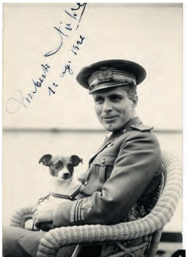
Umberto Nobile in 1926. Hij is de initiatiefnemer van de poolexpeditie met zeppelin Italia.