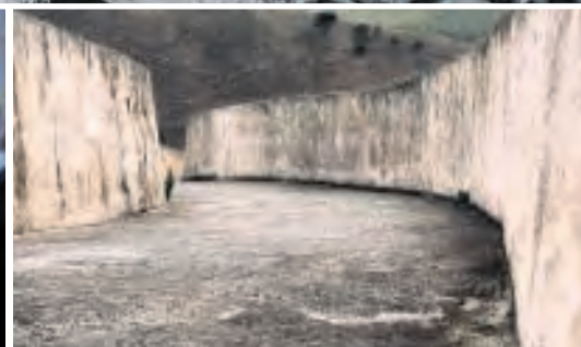
Boven: scène uit Il Grande Cretto di Gibellina van Petra Noordkamp. In de film zie je het licht veranderen: van avondblauw, naar ochtendroze en verblindend wit rond het middaguur. In het midden: bewoners voor de aardbeving.